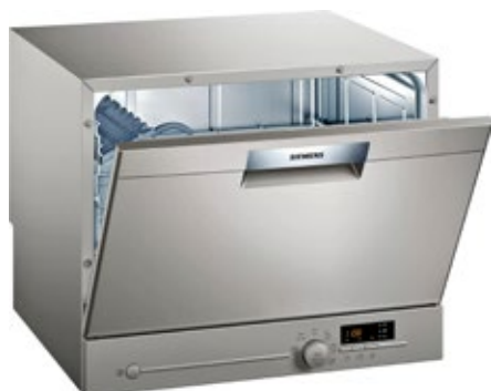
SIEMENS iQ300 SK26E822EU

Kosz wewnątrz zmywarki nabladowej, w którym układamy naczynia, podobnie jak w przypadku zmywarek kompaktowych o szerokości 45 cm, jak i pełnogabarytowych o szerokości 60 cm, wyposażony jest w obracane kółka lub specjalne prowadnice, które