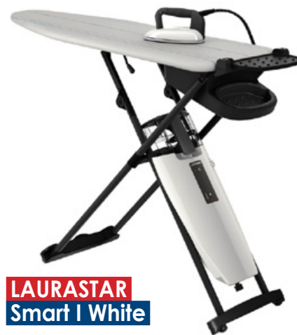
LAURASTAR Smart I White

je lub ostygnie. Bez względu na to, kto prasuje, prasowanie trwa krócej. Ważną funkcją jest możliwość prasowania w pionie za pomocą pary, bo można jej użyć przy odświeżaniu zasłon, firan czy też ciężkich okryć. Warto w tym miejscu jeszcze wspomnieć o systemie zabezpieczającym przed kapaniem, które zdarza się podczas prasowania z niższą temperaturą lub gdy żelazko nie osiągnie jeszcze tej zaprogramowanej. Anti Drip lub Anti Drop to najczęściej używane nazwy tej funkcji.