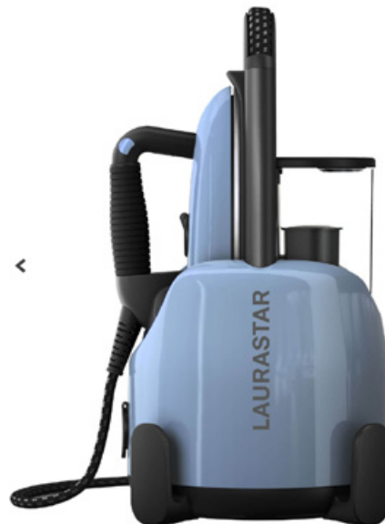
LAURASTAR Lift Plus Blue Sky

Jako że zarówno systemy do prasowania, jak i generatory pary nie są tanimi urządzeniami, warto więc zwrócić uwagę na kwestię ich naprawialności. Przez pewien czas chroni nas, oczywiście, gwarancja producenta, jednak również po tym okresie powinny być dostępne części zamienne do sprzętu. W wypadku produktów renomowanych firm, jak Laurastar, urządzenie projektowane jest tak, żeby jego trwałość nie była mniejsza niż 10 lat. Ponadto firma nie prowadzi działań mających celowo postarzać urządzenia przez wprowadzanie niekompatybilnych rozwiązań, wymuszających zakup nowego sprzętu. Laurastar gwarantuje rów-