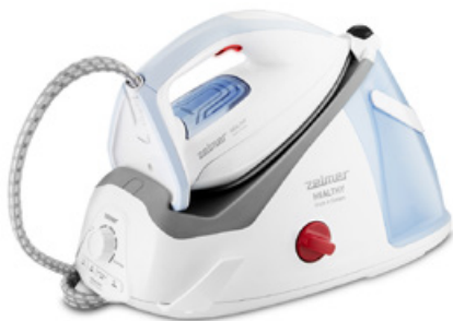
ZELMER ZIS8700 Healthy