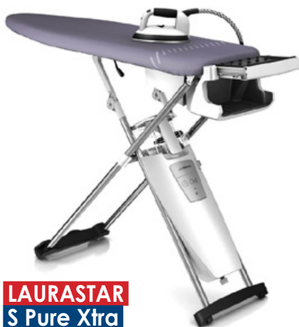
LAURASTAR S Pure Xtra

Ogólna masa generatorów pary czy systemów do prasowania jest znacznie większa niż tradycyjnych żelazek. Składają się na nią wszystkie elementy, jak wytwornica pary, w której przecież znajduje się woda, również ma-