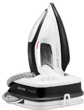
ZELMER ZIS8402 Pro-Compact

wany przez kilka kolejnych minut. Oczywiście, w różnych modelach jest to rozwiązane inaczej. Może się to dziać np. za sprawą czujnika zamontowanego w uchwycie. Często takie automatyczne wyłączenie nazywane jest strażakiem i polega na wyłączeniu urządzenia, gdy nie jest ono używane przez określony czas, którego długość zależy od pozycji żelazka. Specjalny czujnik zareaguje np. po ok. 30 sekundach, gdy będzie ono w pozycji poziomej, lub po ok. 6 – 8 minutach przy pozycji pionowej. Aby ponownie uruchomić generator pary, trzeba na nowo rozpocząć prasowanie. Niektóre modele mają dodatkowo diodę i sygnał dźwiękowy, które zanim urządzenie zostanie wyłączone, poinformują o tym. Tak oto nie grozi nam już ani „spalenie” prasowanej rzeczy, ani tym bardziej mieszkania. Bezpieczeństwo to również ochrona samego urządzenia, które w wersji nowoczesnej wcale nie jest tanie. Dlatego stosuje się systemy i funkcje niepozwalające osadom wapiennym zadomowić się w kanałkach żelazek. A osad jest ich największym wrogiem.