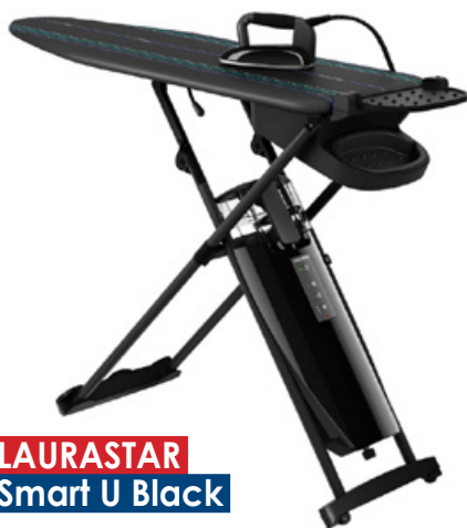
LAURASTAR Smart U Black

Urządzenia te dzięki swojej dużej wydajności bez problemu pozwolą uzyskać dobre efekty na różnych tkaninach i w krótszym czasie. Z kolei zastosowane tryby automatyczne sprawiają, że nie musimy pamiętać o wyborze odpowiedniej temperatury. Choć zajmują więcej miejsca niż tradycyjne żelazka parowe, to suma ich zalet sprawia, że coraz częściej je zastępują, zwłaszcza gdy prasujemy bardzo dużo. Nale-