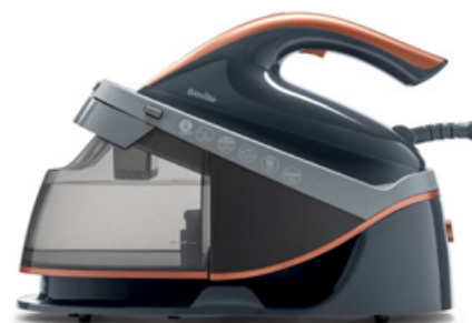
BREVILLE PressXpress VIN411X

się budową i zastosowanymi rozwiązaniami. Do grupy tej należą także stanowiska do prasowania, składające się z deski oraz parownicy z żelazkiem. W wypadku systemów możemy mówić o dużych kosztach. Są jednak doskonałą propozycją dla tych osób, które dużo i często prasują i oczekują najlepszych rezultatów. Potrzebują sporo wolnego miejsca, ale można je składać, dzięki czemu łatwiej jest je przechowywać. Mogą mieć nawet kółka, które ułatwiają ich ustawienie w pomieszczeniu. W porównaniu z klasycznymi żelazkami mają zdecydowanie bardziej rozbudowaną konstrukcję. Największym wyróżnikiem jest aktywna deska do prasowania, wyposażona w funkcje nadmuchu lub zasysania. W zależności od oczekiwanych rezultatów pozwala to na optymalne ułożenie tkaniny na jej powierzchni.