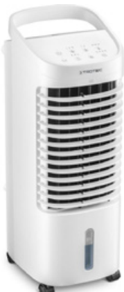
TROTEC PAE 19 H

wygodna jest funkcja opóźnionego startu, która powoduje, że przed powrotem do domu urządzenie zdąży schłodzić pokój. Warto sprawdzić, ile urządzenie ma trybów pracy (np. automatyczny, nocny, z opóźnionym startem) i prędkości nawiewu (dwie lub trzy). Najczęściej urządzenie pamięta ostatni ustawiony tryb pracy i prędkość wentylatora. W trybie sleep prędkość nawiewu jest najmniejsza oraz wyłączone są wskaźniki świetlne. Dzięki temu urządzenie pracuje cicho i nas nie rozprasza. Przy praktycznym użytkowaniu warto zwrócić uwagę na kół-