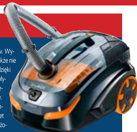
THOMAS DryBox Amfibia Pet

Model DryBox Amfibia jest dostępny wyłącznie w autoryzowanym skle-