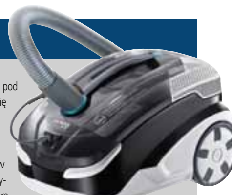
THOMAS Vestfalia XT

ka wewnątrz szczotki. Jest to możliwe dzięki otwieranej i zdejmowanej osłonie wałka, po zdjęciu której z łatwością możemy z niego usunąć włosy i sierść. Producent umieścił również w zestawie specjalną ssawkę do tapicerki o szerokości 19 cm. Doskonale sprawdza się ona w usuwaniu sierści oraz odkurzeniu tapicerki nie tylko w domu, lecz także w samochodzie. „Plus” w nazwie odkurzacza nie jest przypadkowy. Nowa wersja została wzbogacona o bardzo praktyczne dodatki. Wśród nich znajdziemy wąż ze zintegrowanym wężykiem doprowadzającym wodę do prania z zaworem odcinającym, dołączaną ssawkę do odkurzenia mebli, ssawkę do przetykania syfonów oraz zapasowy filtr HEPA 13.