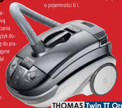
THOMAS Twin TT Orca

czotką i ssawką do tapicerki do zbierania sierści w zestawie oraz Twin TT Orca, który oprócz tego, że wyposażony jest w filtr wodny, ma funkcję odplamiania dywanów i tapicerki oraz zbierania wody. Model Twin Aquawash Pet dostępny jest wyłącznie w sklepach Media Expert, a Twin TT Orca w sieci EURO-net. Wszystkie odkurzacze Thomas Twin mogą również pracować z workiem tekstylnym o pojemności 6 l.