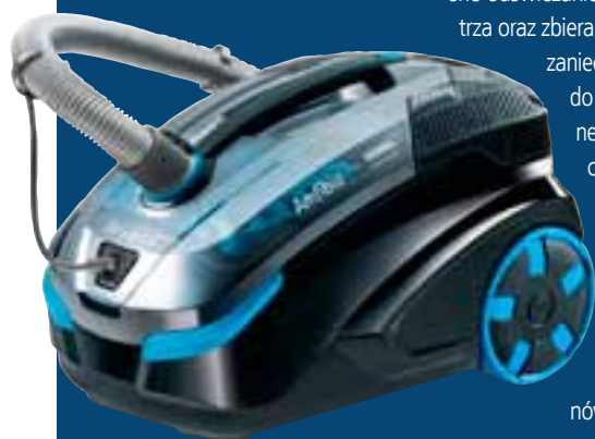
THOMAS DryBox Amfibia

Odkurzacze Thomas DryBox Amfibia Pet z zestawem akcesoriów dla posiadaczy zwierząt domowych jest dostępny na wyłączność w sklepach Media Expert. Wyróżnia się turboszczotką, która ułatwia usuwanie włosów czy sierści z dywanów. Zostanie on więc doceniony przez wszystkich posiadaczy czworonogów.