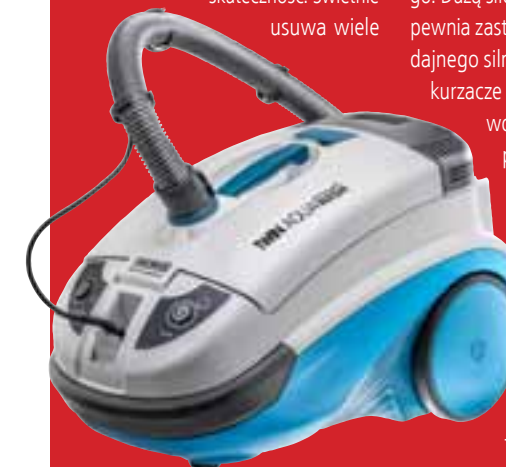
THOMAS Twin Aquawash

Odkurzacze marki Thomas z serii Twin to znakomita propozycja dla użytkowników poszukujących sprzętu funkcjonalnego, z dużymi możliwościami, dbającego o czystość powietrza i efektywnie usuwającego kurz, a także dostępnego w przystępnej cenie. Odkurzacze zostały wyposażone w filtr wodny, który wpływa na ich niezwykle dużą skuteczność. Świetnie usuwa wiele