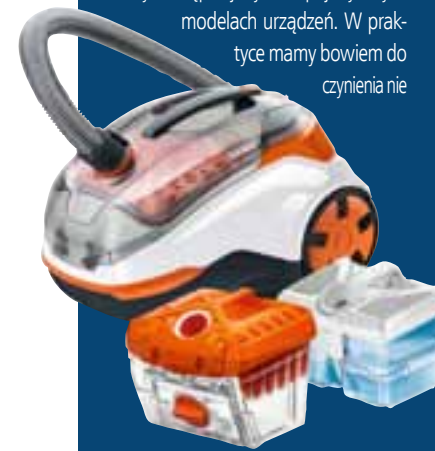
THOMAS Cycloon Hybrid Pet&Friends

Innowacyjność linii Cycloon Hybrid polega na połączeniu funkcjonalności odkurzaczy cyklonowych oraz nierównanej skuteczności w oczyszczaniu, jaką gwarantuje filtr wodny. Co ciekawe, nowatorską jest tu także konstrukcja samego filtra cyklonowego, która zapewnia doskonałą separację dużych zanieczyszczeń od drobnego kurzu i zanieczyszczeń. Jest to rozwiązanie unikatowe na rynku odkurzaczy, dostępne jedynie w pojedynczych modelach urządzeń. W praktyce mamy bowiem do