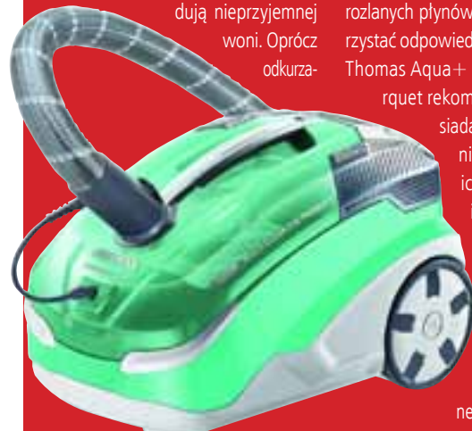
THOMAS Aqua+ Multiclean X10 Parquet

Linia Aqua+ marki Thomas na polskim rynku jest dostępna w trzech modelach odkurzaczy, które wyróżniają się możliwością zastosowania filtra wodnego Aqua+ lub worka tekstylnego o dużej pojemności, które uzupełniają filtr HEPA 13 oraz mikrofiltr powietrza wylotowego. Filtr wodny Aqua+ niezależnie od poziomu zapelnienia zbiornika zapewnia stałą siłę ssania oraz zatrzymuje 99,99 proc. alergenów. Dzięki temu zaraz po odkurzeniu powietrze w pomieszczeniu jest czyste i świeże. Filtr jest przy tym łatwy w czyszczeniu i obsłudze. Wydajny silnik ma dwa oddzielne obiegi powietrza. Cząstki kurzu nie przedostają się do silnika i nie powodują nieprzyjemnej woni. Oprócz odkurza-