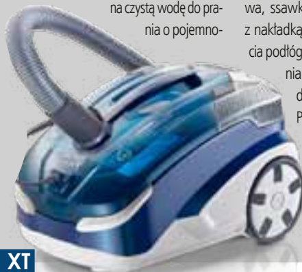
THOMAS Twin XT

ści 1,8l oraz system spryskiwania pod ciśnieniem. W zestawie znajdują się teleskopowa rura ze stali nierdzewnej, szczotka parkiet/dywan, szczotka do tapicerki, ssawka szczelinowa, ssawka do prania dywanów z nakładką do zbierania wody/mycia podłóg twardych, ssawka do prania tapicerki oraz płyn do prania dywanów i tapicerki Thomas ProTex. Model Vestfalia XT dodatkowo wyposażony został w turboszczotkę, która znacząco ułatwia zbieranie np. sierści z dywanów i wykładzin, polecić go można więc